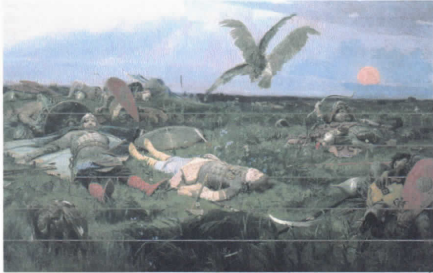
"Битва на Куликовом поле"

1. Напишите не менее 10 - 15 определений или словосочетаний с ними, которые понадобятся для рассказа о ваших впечатлениях от картины В. Васнецова. Определения нужно подобрать так, чтобы точно описать происходящее и передать настроение картины. Определите название картины. Что вам известно о ней?